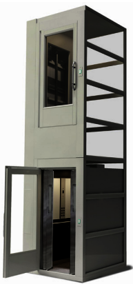
ARITCO LIFT 2026 Jan ES

El modelo Aritco 9000 incluye opciones de personalización. A la hora de diseñar y personalizar su ascensor, usted puede elegir de entre más de 200 colores, 2 tipos de vidrio y 7 suelos diferentes. El ascensor es muy práctico, tiene funciones inteligentes y ofrece a todos acceso a diferentes plantas en edificios públicos y comerciales. Está disponible en dos tamaños diferentes, en los que cabe un cochecito o una silla de ruedas. Es fiable y tiene un diseño robusto apto para entornos públicos y comerciales difíciles. El ascensor está equipado con nuestro sistema SmartSafety que ofrece funciones de seguridad para hacer frente a todas las situaciones que pueden ocurrir en espacios públicos y comerciales, así como para prevenir accidentes.